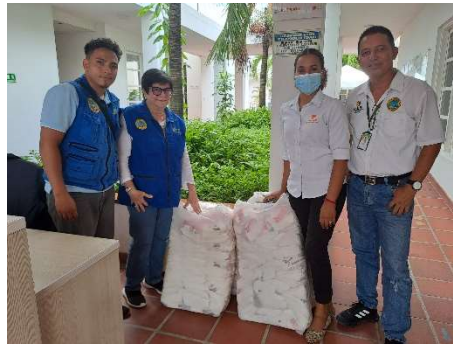
Pie de foto: Donación 225 bolsas de detergente Dersa al Plan de Emergencia Social Pedro Romero para proyecto de capacitación en higiene y saneamiento.