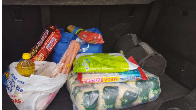
Pie de foto: Donación de mercado al comedor comunitario de Marlinda