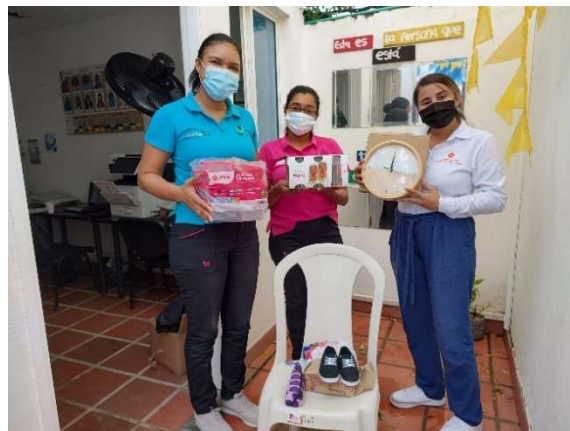
Pie de foto: Donación de 6 regalos al Centro de Desarrollo Infantil para bingo comunitario