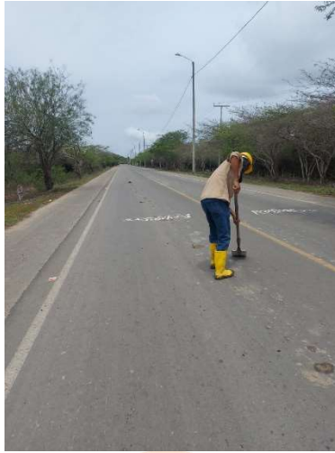
Pie de foto: Se realiza limpieza y humectación en la vía principal de Manzanillo del Mar