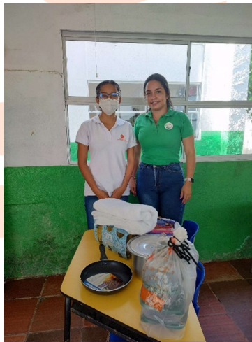
Pie de foto: Donación de 6 premios a la Institución Educativa Puerto Rey para bingo familiar.