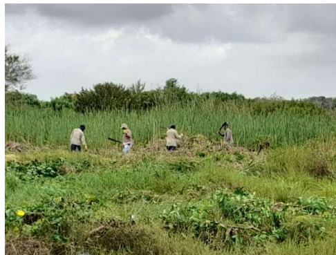
Pie de foto: Realizamos poda y limpieza de lote destinado para cementerio en la comunidad de Tierra Baja