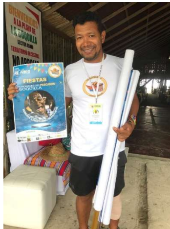
Pie de foto: Donación de 1 pasacalle, 3 pendones, 50 afiches y 300 refrigerios para las fiestas del pescador en la Boquilla 2022.