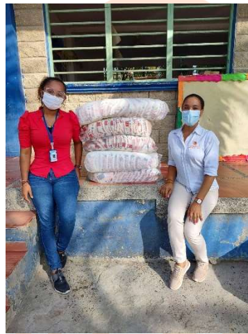
Pie de foto: Donación de 225 bolsas de detergente Dersa a la Institución Educativa Manzanillo del Mar.