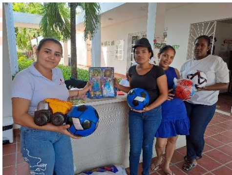
Pie de foto: Donación de 20 regalos de navidad a la Asociación de Mujeres Afrodescendientes de Manzanillo del Mar.