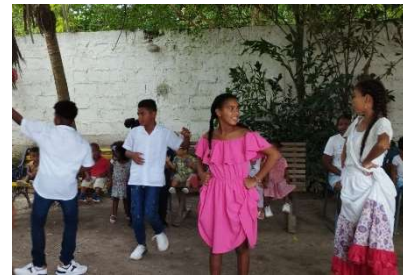
Pie de fotos: Conmemoración del día de la Diversidad Cultural