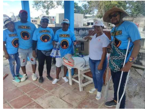
Pie de foto: Realizamos donación de 200 sacos, 20 guantes domésticos y 75 refrigerios a la empresa de Ecoturismo Arriberos de la Boquilla como apoyo a la jornada de limpieza en el Cementerio.