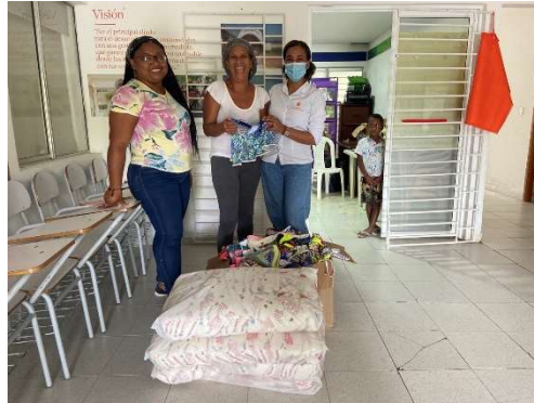
Pie de foto: Donación de 135 bolsas de detergente Dersa y 50 vestidos de baño a la Junta de Acción Comunal de Tierra Baja.