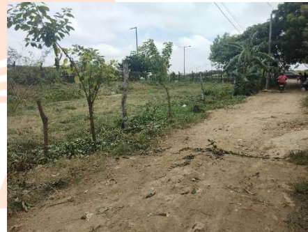
Pie de foto: Ante la solicitud de la comunidad, realizamos jornada de desmonte en el sector Minuto de Dios, como parte de la preparación para una jornada de limpieza organizada por el Consejo Comunitario de Tierra Baja.