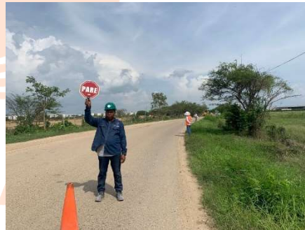
SERENA DEL MAR Pie de foto: Limpieza, humectación y señalización de la vía de Tierra Baja.