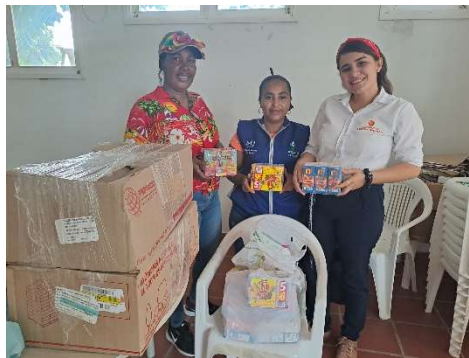
Pie de foto: Donación de 100 refrigerios para el Cabildo de Manzanillo del Mar, organizado por la Corporación los Ángeles, operador del CDI Modalidad Familiar.