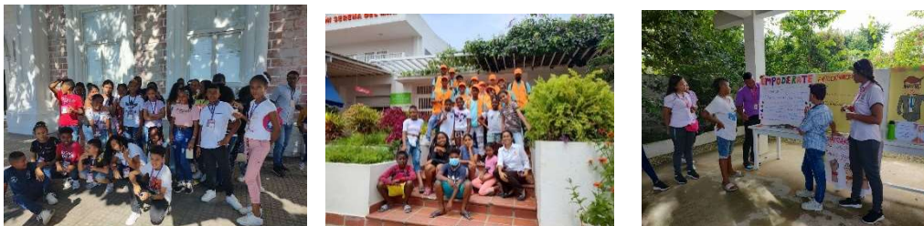
Pie fotos: Foros, talleres y actividades con los niños del grupo de liderazgo.

La Corporación Universitaria Rafael Núñez es un aliado fundamental en este proceso, puesto que se vincula a estos espacios trayendo talleres a los jóvenes como el uso correcto de las pantallas al momento de realizar deberes escolares o para el entretenimiento y talleres de Empoderamiento y asertividad para un liderazgo eficaz.