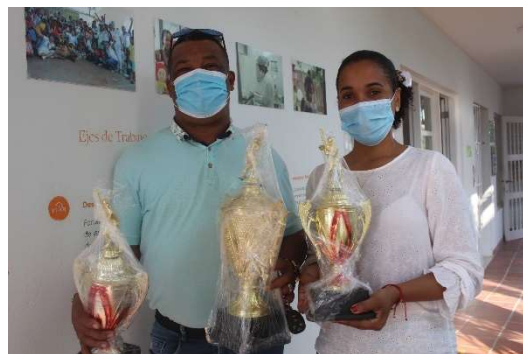
Pie de foto: Apoyamos a las escuelas deportivas con la Donación de 3 trofeos para ser entregados en el torneo de béisbol de la comunidad.