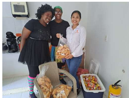
Pie de foto: Donación de 100 refrigerios para el Cabildo de Tierra Baja, organizado por la Corporación los Ángeles, operador del CDI Modalidad Familiar.