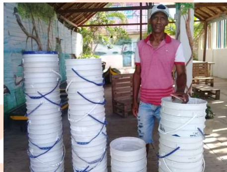
Pie de foto: Donación de a Ecotours Boquilla, para adecuación y embellecimiento de Muelle.