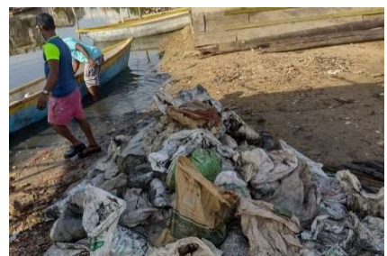
Pie de foto: Financiamos la limpieza del canal "EL Túnel del Amor" que surge por la necesidad de habilitar el canal para facilitar el desarrollo de la actividad de ecoturismo y pesca