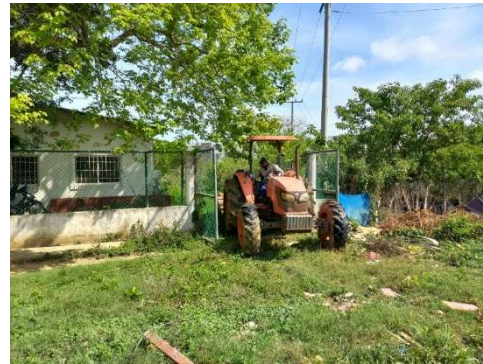
Pie de foto: Realizamos limpieza y desmonte de la UPA de la comunidad de Tierra baja.