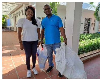
Pie de foto: Donación de regalos de navidad a las empresas de Ecoturismo: Arriberos y Ematuecob