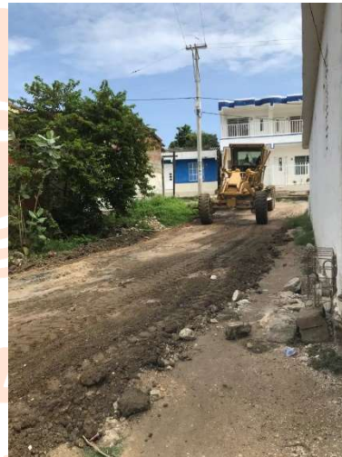
Foto: En respuesta a la solicitud de la Junta de Acción Comunal de la comunidad de Manzanillo del Mar, apoyamos la adecuación de vías.