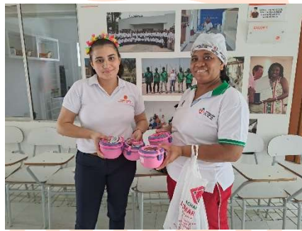
Pie de foto: Donación de 100 refrigerios y 6 premios para el Cabildo de los Hogares comunitarios de Tierra Baja, organizado por las madres comunitarias.