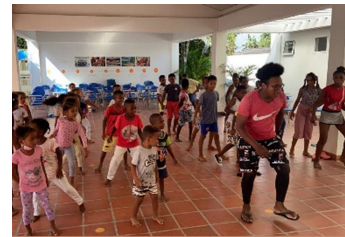
Pie de fotos: Encuentros de Promoción de lectura, Lectoescritura y Danza.