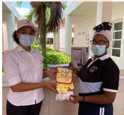
Pie de foto: Donación de 4 regalos para bingo en la Institución Educativa Manzanillo del Mar.