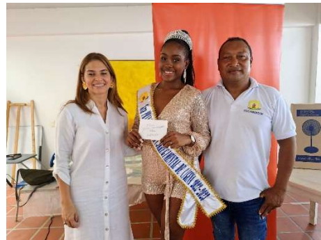
Pie de foto: Entrega de premios a reinas en el marco del reinado intercorregimental.