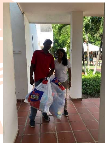
Pie de foto: Donación de regalos de navidad a Asociación de pescadores “Asopbocan” y a la Asociación de pescadores “Mi Atarraya”.