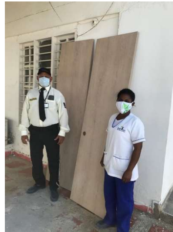
Pie de foto: Donación de 225 bolsas de detergente Dersa y 2 puertas a la Institución Educativa de Tierra Baja.