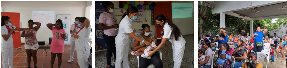
Pie fotos: Charlas sobre promoción de lactancia materna y prevención de cáncer de mama en las comunidades.