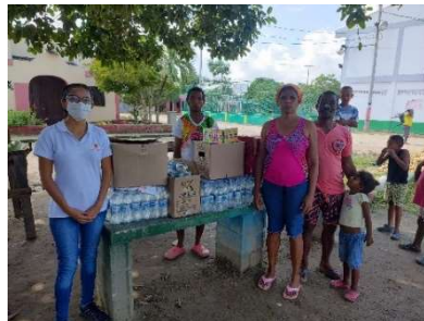
Pie de foto: Donación de 150 refrigerios para el Festival de la Patilla en la comunidad de Puerto Rey.